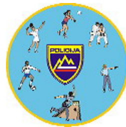
ŠD UJV MURSKA SOBOTA