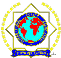
REGIONALNI KLUB ZA POMURJE